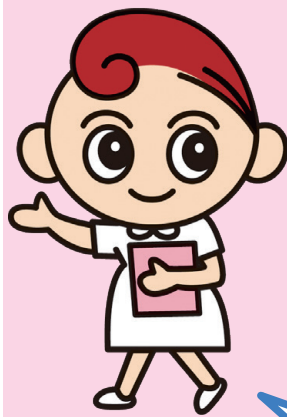
当院イメージキャラクター 「くるくるちゃん」

看護部には、看護部管理室という部署があります。私たち管理室は、病院経営に参画し、質の高い看護サービスが提供できるように、看護職員を様々な場面でサポートしています。教育研修の企画・実施、看護師の採用・配属、また、多くの入院患者さんを受入れられるように病棟のベッドを管理する業務などがあります。当院の看護職員が専門職としての知識・技術を持ち、医療人としての態度・心構えを持った人材に成長できるようサポートすることで、地域の方々に信頼していただける安全で安心な温かい看護を提供することを目指して活動しています。