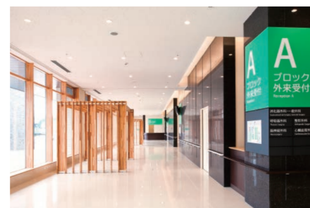
6月新規開院 魚沼基幹病院

6月より、魚沼地域の医療体制が大きく変わります。新規開院の魚沼基幹病院、魚沼市立小出病院、南魚沼市立六日町病院の主な外来診療について、お知らせします。