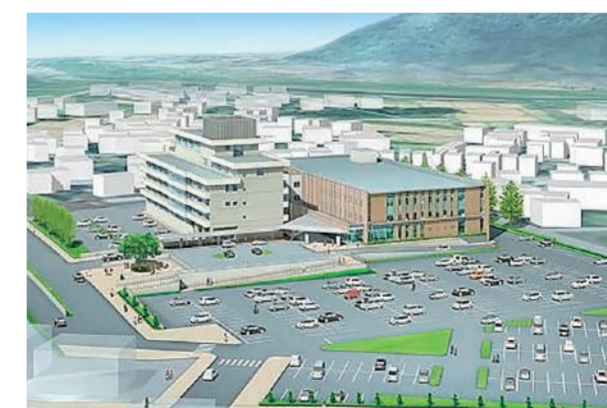
県立病院から市立病院へ 魚沼市立小出病院

新潟大学地域医療教育センターと連携して、三次救急、高度医療、救命救急・外傷センター、地域周産期母子医療センターなど、これまで魚沼地域になかった機能を備えます。