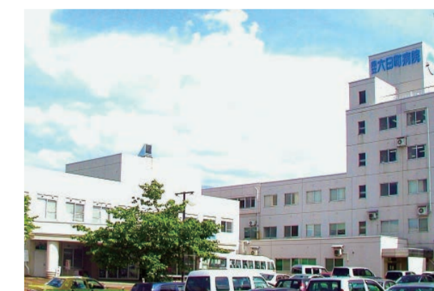
県立病院から市立病院へ 南魚沼市立六日町病院

新たに完成した施設と現・小出病院施設の一部を利用し、魚沼市立小出病院として再スタート。地域に密着した医療を行うとともに、魚沼基幹病院と連携します。また、2016年4月からは、療養病床44床を増床する予定です。